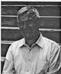
Dieses Foto kann in der Pressestelle der Universität Greifswald abgerufen werden.

Internetseite von Prof. Dr. e. Gerd Müller-Motzfeld: http://www.mnf.uni-greifswald.de/fr-biologie/zool-institut-museum/ehemalige/mueller-motzfeld.html