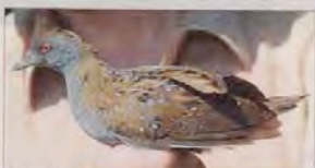
Eine ornithologische Sensation: So sieht ein Zwergsumpfhuhn aus. Der Rallenvogel wurde 90 Jahre lang in Ostdeutschland nicht nachgewiesen.

Ornithologen der Uni Greifswald haben einen als ausgestorben geltenden Vogel wieder entdeckt.