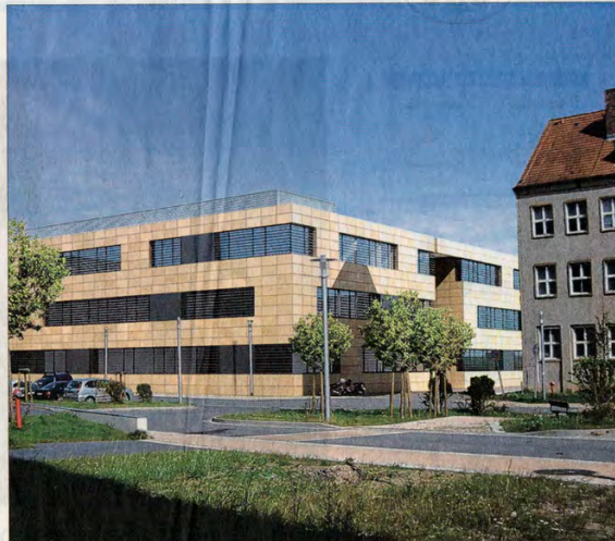
Blick von Südosten auf das Laborgebäude in einer Computeranimation des Ingenieurbüros